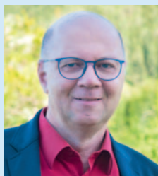
Rudi Mayr Bürgermeister von Klaus