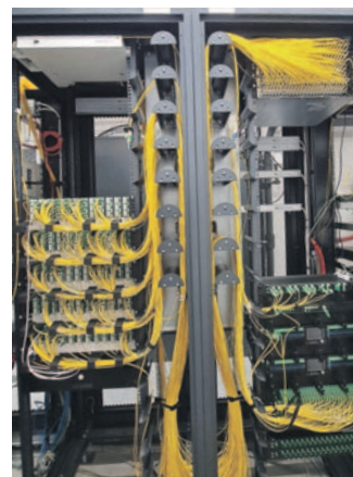
Der neue Firmensitz in Leonstein befindet sich auf dem neuesten Stand der Technik.

Um auch räumlich mit dem raschen Ausbau mithalten zu können, übersiedelte Brandstetter Kabelmedien vor einem Jahr ins neue Dienstleistungszentrum in Leonstein. „Dank modernster Technik haben wir dort die Möglichkeit, in Zukunft weiter zu wachsen!“ Alle Infos: www.bk-medien.at