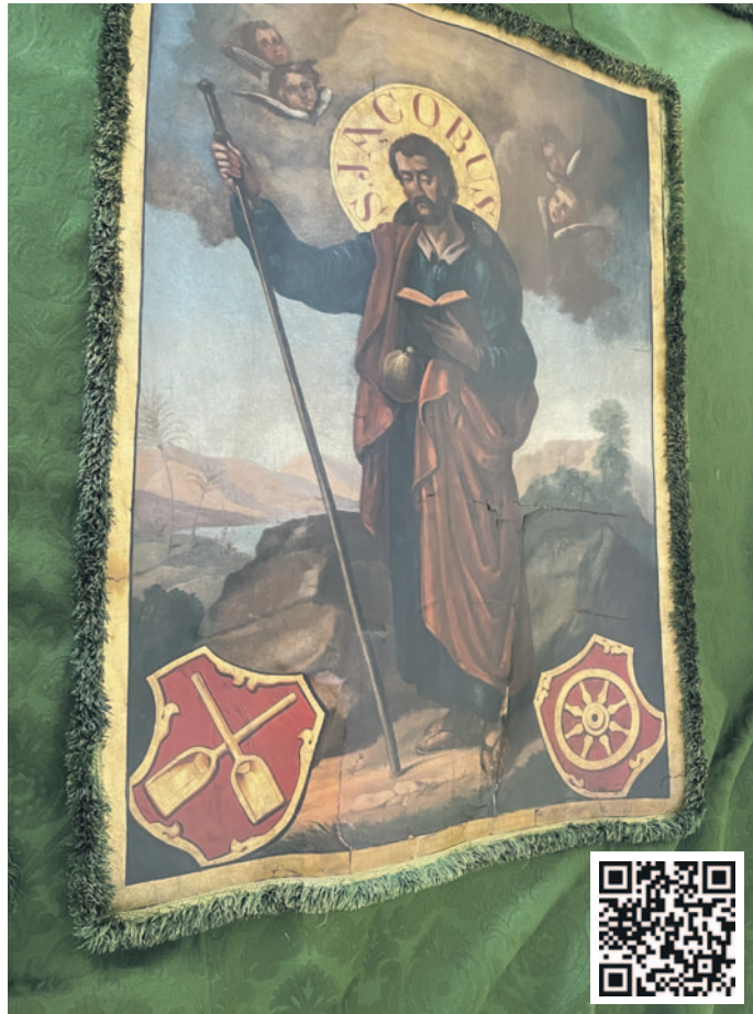
Eine Seite der Zunftfahne zeigt den Heiligen Jakobus.

Nähere Infos gibts bei Obfrau Eva Bachinger, Tel. 07584 79206 oder unter eva@goldhauben-molln.at . Der QR-Code im Foto führt direkt auf die Homepage zur Restaurierung der Fahne!