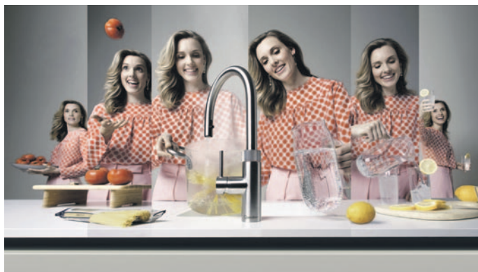
Quooker – der Wasserhahn, der alles kann (liefert stilles gekühltes, prickelndes oder kochendes Wasser)