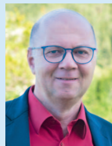
Rudi Mayr Bürgermeister von Klaus