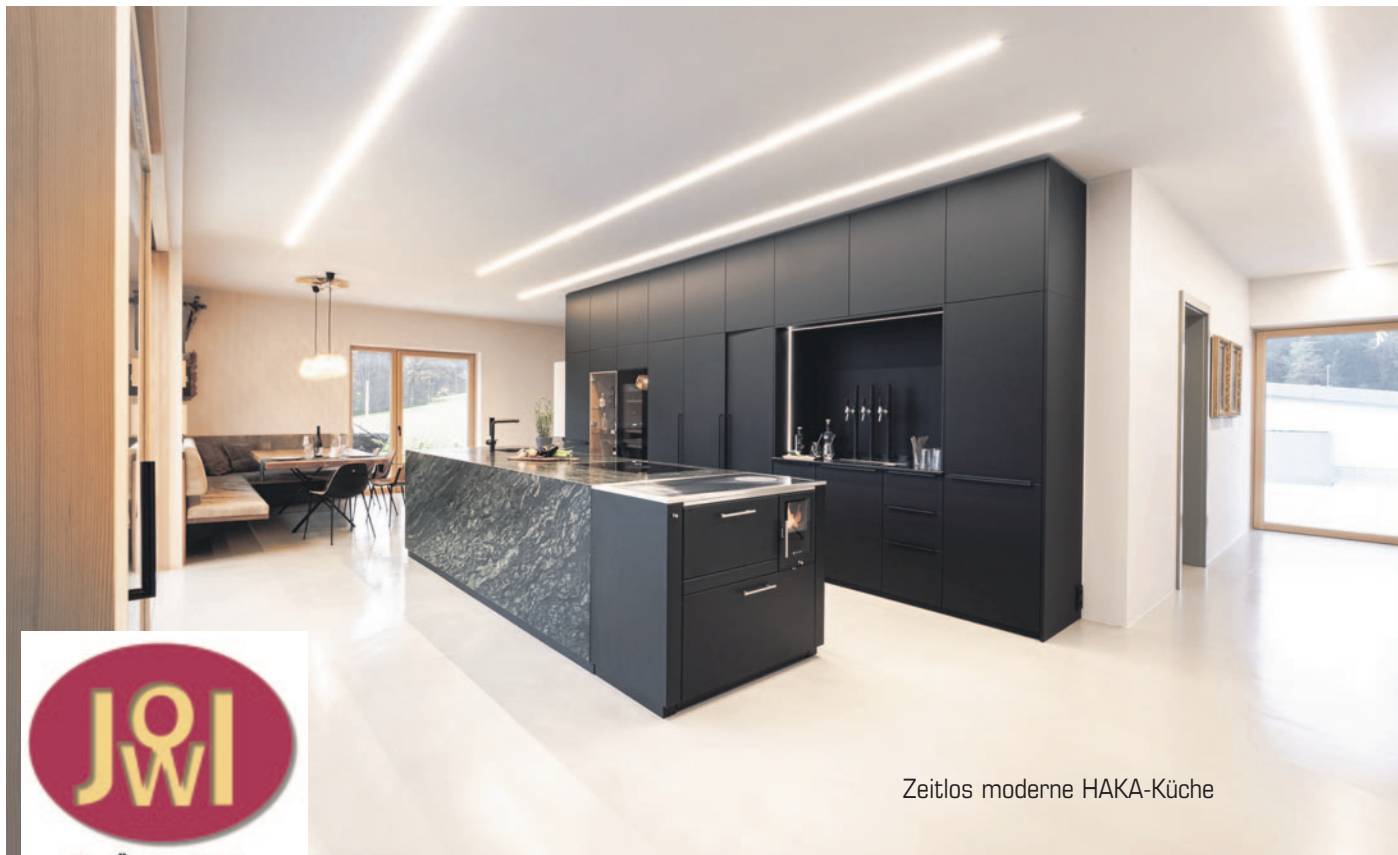
Zeitlos moderne HAKA-Küche