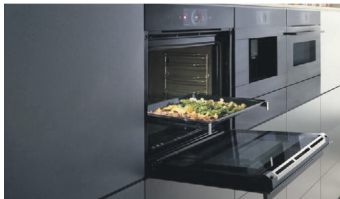
Die neue Dampfbackofenserie von Bosch inkl. Air Fry Funktion – zu Hause frittieren!