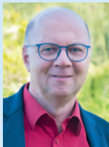
Rudi Mayr Bürgermeister von Klaus